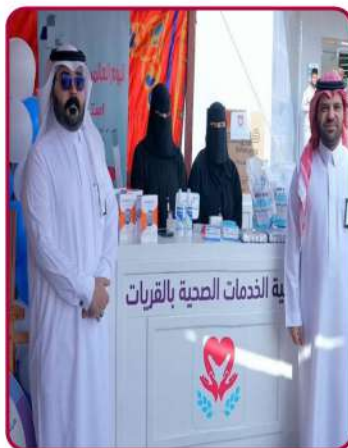
مشاركة مع مركز السكر