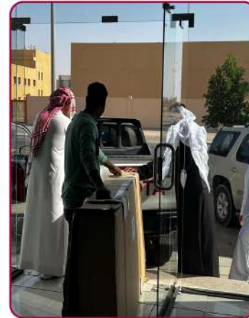
تسليم المستلزمات الطبية لمستفيدين الجمعية