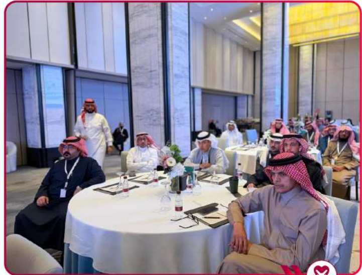
مشاركة في ورشة عمل لمنصة شفاء بمدينة الرياض