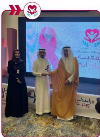
مشاركة مع مكتب وزارة الصحة بالقريات (فعالية رايتك وردية)