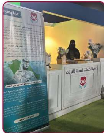
مشاركة اليوم الوطني