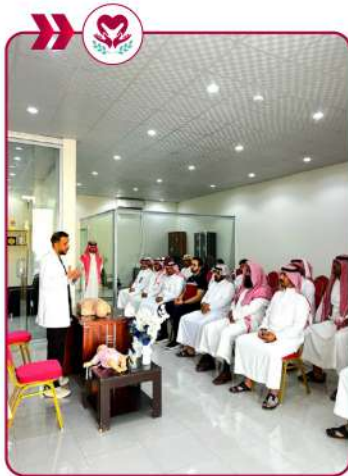
إقامة دورة إسعافات أولية لمستفيدين الجمعية