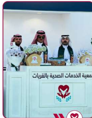
مشاركة في يوم التأسيس